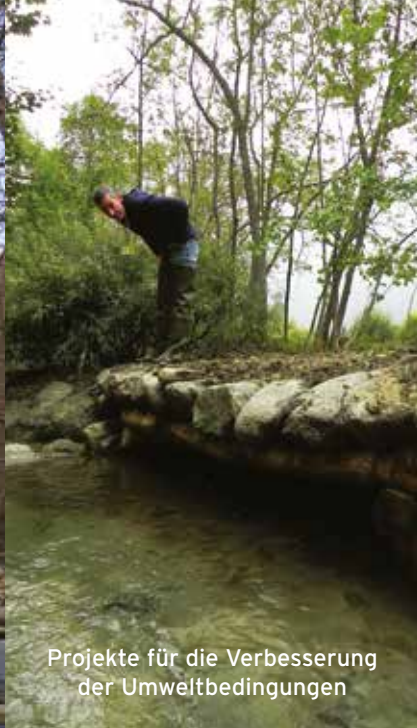
Projekte für die Verbesserung der Umweltbedingungen