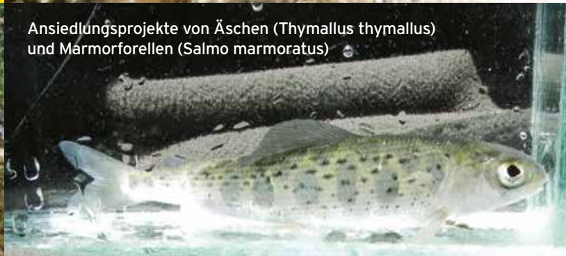
Ansiedlungsprojekte von Äschen ( Thymallus thymallus ) und Marmorforellen ( Salmo marmoratus )