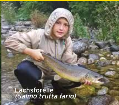
Lachsforelle ( Salmo trutta fario )