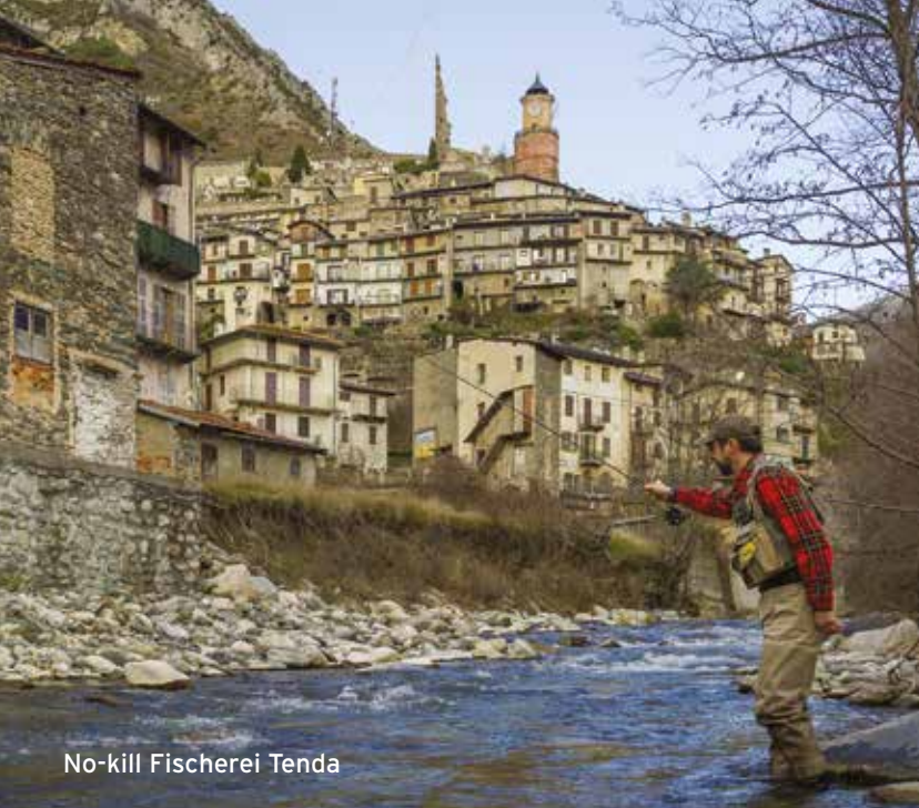
No-kill Fischerei Tenda