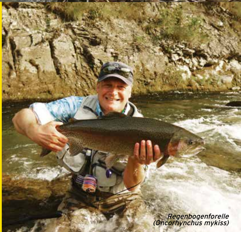
Regenbogenforelle ( Oncorhynchus mykiss )

Wo einmal das italienische Königshaus ihren exklusiven "Angeln- und Jagdgarten" hatte, können Sie heute eine privilegierte Fliegenfischen Revier genießen, die "Königin der Wunder - Reine des Merveilles" heißt: Sie wird dem Fliegen- und Wanderfischen gewidmet. Von Bergen und Schneefeldern umgebenem kristallblauem Wasser, atemberaubende Landschaften, die ortsspezifischen Fauna und Flora, Seen, Flüsse und Schwalle kennzeichnen diese Gegend zwischen Italien und Frankreich. Wasserläufe und Alpenseen sind ein Wirt für die großen Bevölkerungen von Bach- und Regenbogenforellen. Ein entwickelndes riesiges Projekt für die Aufwertung der ortsspezifischen Forellen und die Wiedereinführung der norditalienischen Äsche. Ein Alpenraum mit originalen Fremdenverkehrseinrichtungen, bekömmlichen und natürlichen heißen Quellen in dem Heilbad der "Thermen von Valdieri" auf der italienischen Seite; das "Tal der Wunder", eine weltweit berühmte archäologische Stätte auf der französischen Seite. Diese Sehenswürdigkeiten sind der ideale Bestimmungsort für Fliegenfischer aus der ganzen Welt und deren Familien.