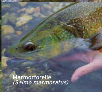
Marmorforelle ( Salmo marmoratus )