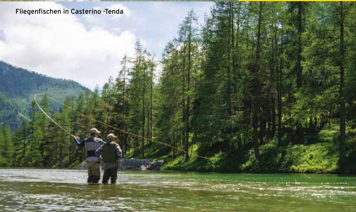
Fliegenfischen in Casterino -Tenda