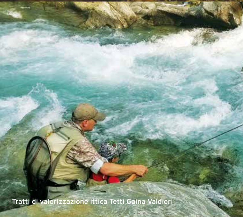
Tratti di valorizzazione ittica Tetti Gaina Valdieri