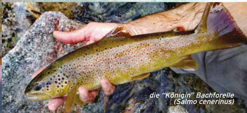
die "Königin" Bachforelle ( Salmo cenerinus )