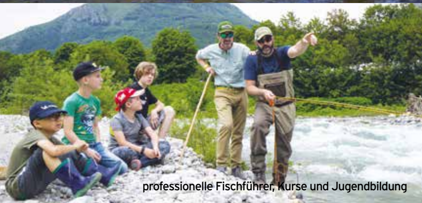
professionelle Fischführer, Kurse und Jugendbildung